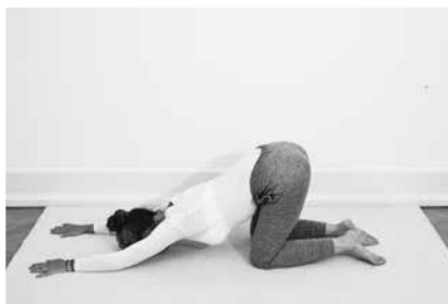
Hundehvalpen 2 minutter (side 104)