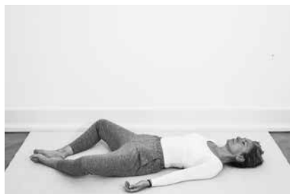
Sommerfuglen 3 minutter (side 120)