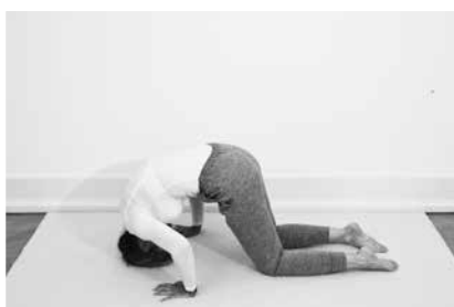
Åbn låget ½ minut (side 147)