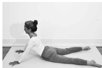
Sælen 1 minut (side 130)