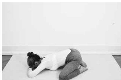
Frøen 3 minutter (side 102)