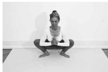
Naturstillingen 1 minut (side 110)