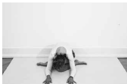
Knudeben 2 minutter til hver side (side 108)