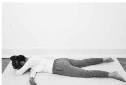
Strandvasker ELLER Ørnearme 2 minutter til hver side (side 128)