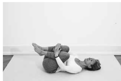
Rygrul ½ minut (side 145)