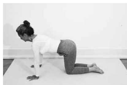
Katten – benpres Hold det i ½ minut (side 142)