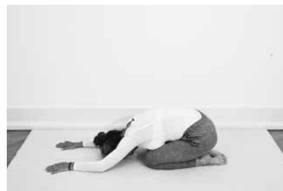
Bedestilling ½ minut (side 92)