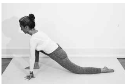
Dragen 2 minutter til hver side (side 94)