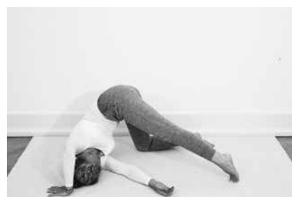
Aben 2 minutter til hver side (side 88)