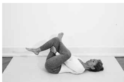
Ballestræk (i stedet for Sovende svane). 2 minutter til hver side (side 90)