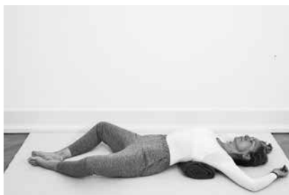
Sommerfuglen liggende (læg noget under brystkassen) 2 minutter (side 120)