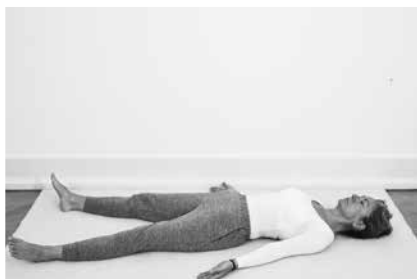
Hvilestillingen – tjek ind 1 minut (side 106)