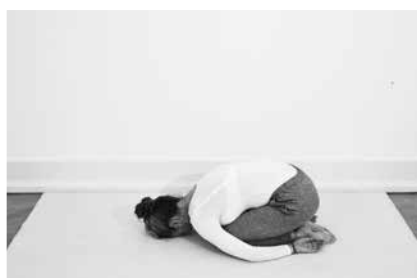
Bedestilling ½ minut (side 92)