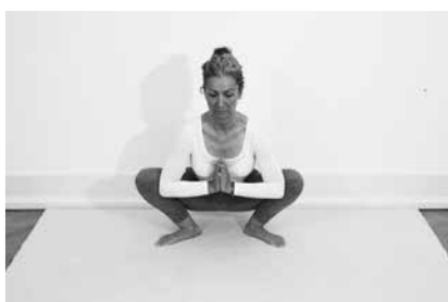
Naturstillingen på flad fod 3 minutter (side 110)