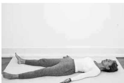
Hvilestillingen ½ minut (side 106)