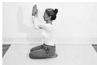
Ørnearme, alternativ til Strandvasker 2 minutter til hver side (side 138)