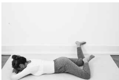
Vinduesviskere på maven ½ minut (side 146)