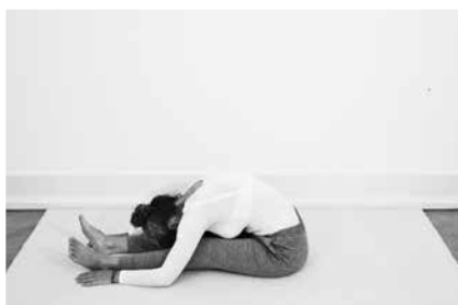
Foroverbøjning siddende 3 minutter (side 98)