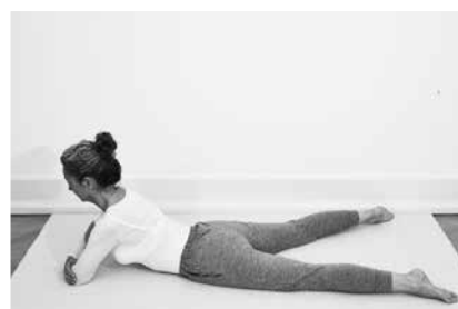
Sfinks 2 minutter (side 118)