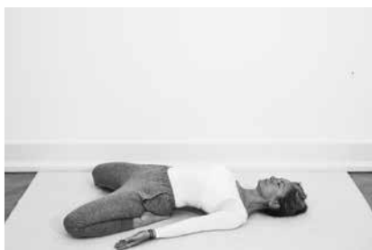
Sadel 3 minutter (side 116)