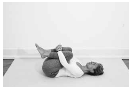
Kramme knæ ½ minut (side 144)