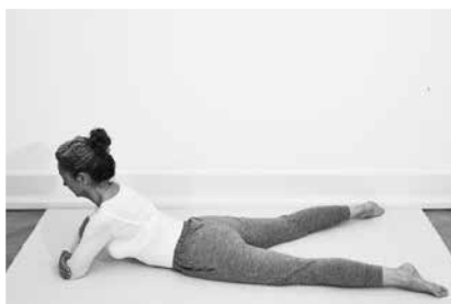
Sfinks 2 minutter (side 118)