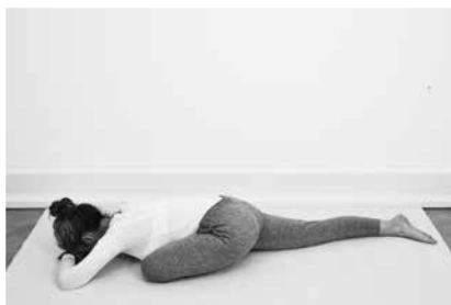
Sovende svane 3 minutter til hver side (side 124)