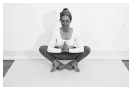
Naturstillingen på tå 1 minut (side 110) (med eller uden blokke)