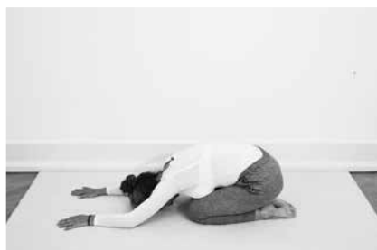
Bedestilling ½ minut (side 92)