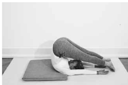
Ploven 2 minutter (side 114)