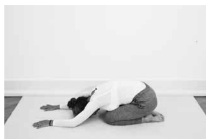
Bedestilling ½ minut (side 92)