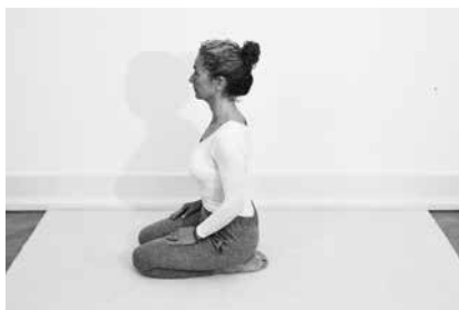
Tordenkile 1 minut (side 132)