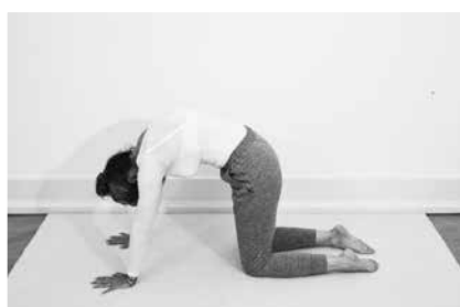
Katten – runde og svaje ½ minut i alt (side 143)