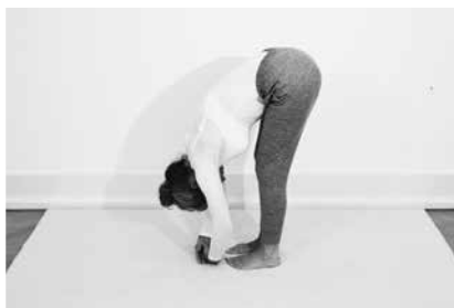
Foroverbøjning stående 3 minutter (side 100)