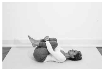
Kramme knæ ½ minut (side 144)