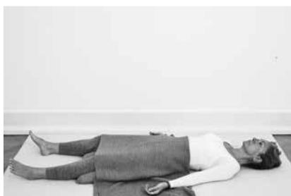
Hvilestillingen – tjek ud 3 minutter (side 106)