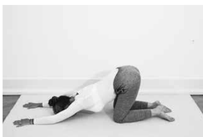
Hundehvalpen 2 minutter (side 104)