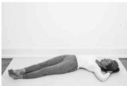
Stjerneblikker 2 minutter til hver side (side 126)