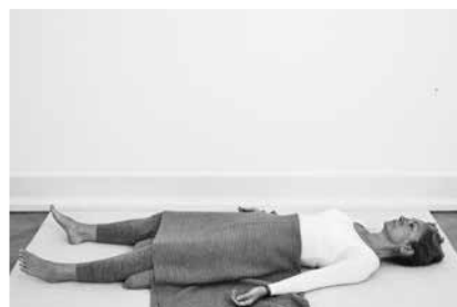
Hvilestillingen – tjek ud 3 minutter (side 106)