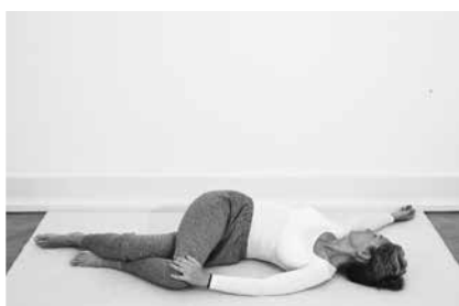
Twist liggende 2 minutter til hver side (side 134)