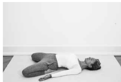
Sadel 3 minutter (side 116)