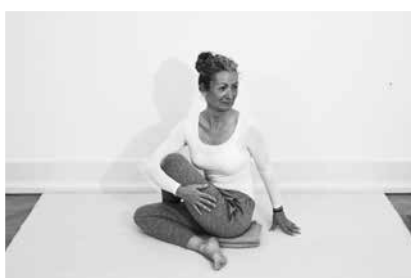
Twist siddende 3 minutter til hver side (side 136)