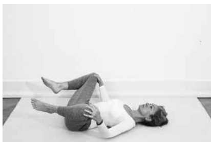
Hofterotation ½ minut (side 141)