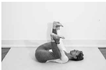
Edderkoppen 3 minutter (side 96)