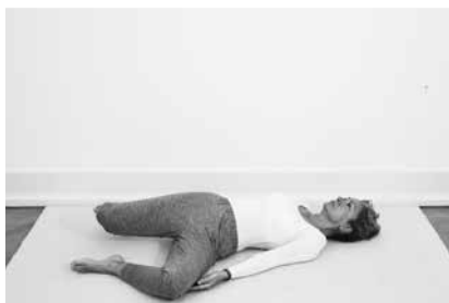
Vinduesviskere ½ minut (side 146)